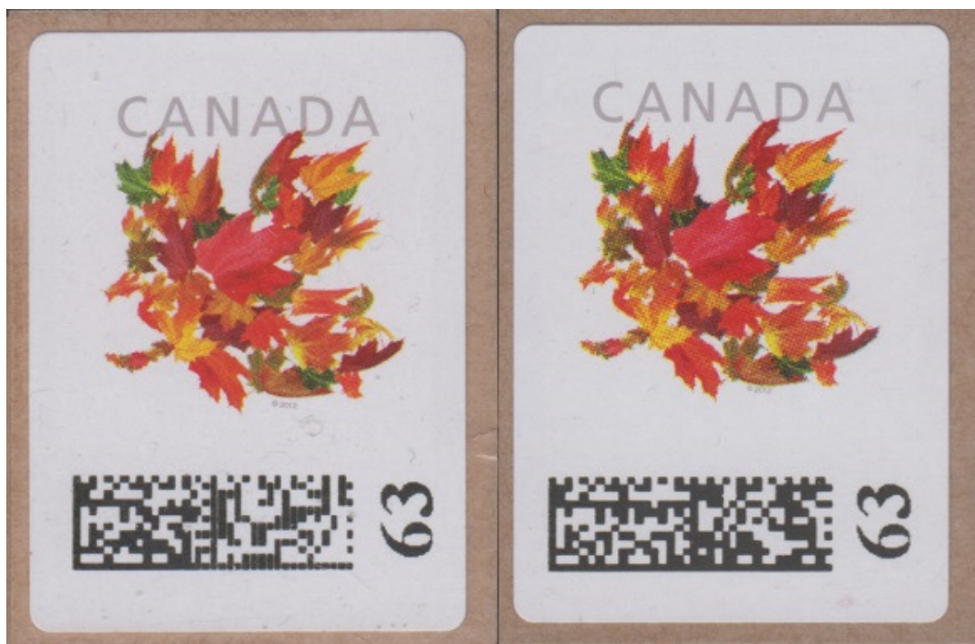
Première émission à gauche et seconde à droite

Les timbres des kiosques libre-service n'ont duré qu'un peu plus de 6 mois, mais ce fut suffisant, semble-t-il, pour qu'ils aient connu deux impressions différentes. La première émission n'avait pas été de très haute qualité, mais au lieu de s'améliorer, la seconde émission fut encore pire.