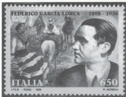
franquistes pendant la guerre civile en 1936. [Italie, 1998]