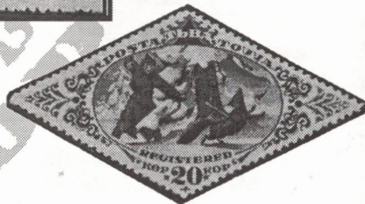
Timbres émis dans les années 30 et 40