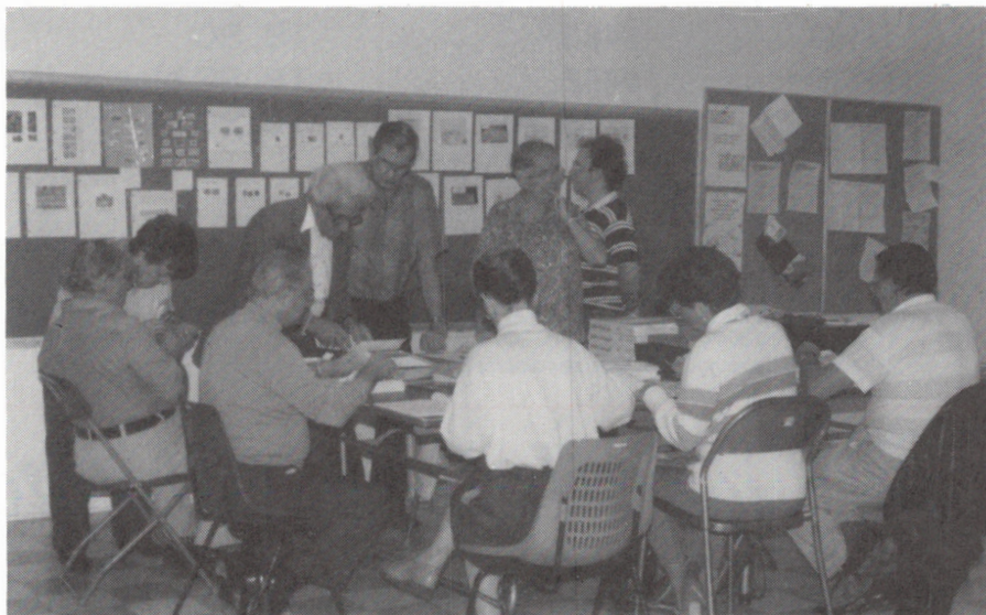
Un club où il fait bon échanger!

(Les réunions se tiennent au Centre Alphonse-Desjardins, situé au 6755, 36e avenue, entre Bélanger et St-Zotique. On peut aussi écrire au club: Philatex Rosemont, C.P. 124, Succ. Rosemont. Montréal (Québec) H1X 3B6.