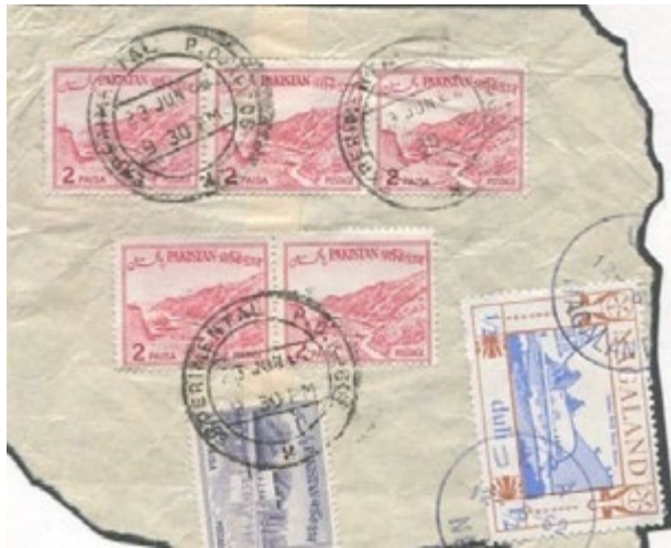
Fragment d'un pli posté le 12 juin 1962