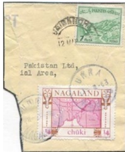
Fragment d'un pli posté le 11 février 1963