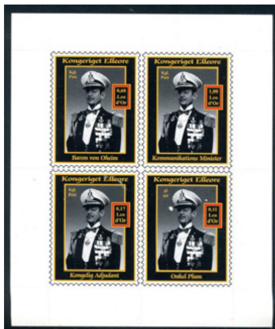
ill. 16 Émis en 2000, Baron von Oheim, ministre des Communications