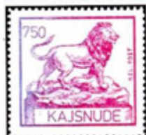
ill. 5 Kajsnude