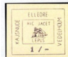
ill. 7 Kajsnude & Vedelholm