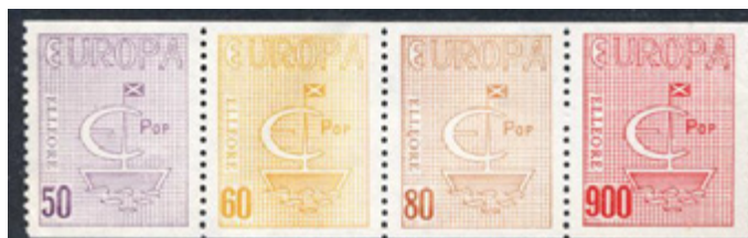
ill. 15 1966 série Europa