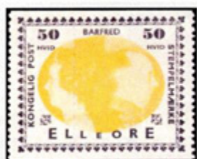
ill. 4 Barfred

Timbres-poste émis pour les colonies d'Elleore