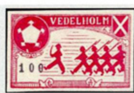
ill. 6 Vedelholm