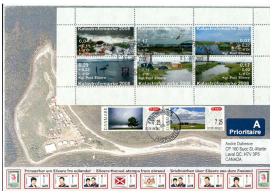
ill. 26 Pli souvenir posté à Elleore à destination de l'auteur le 5 août 2012.