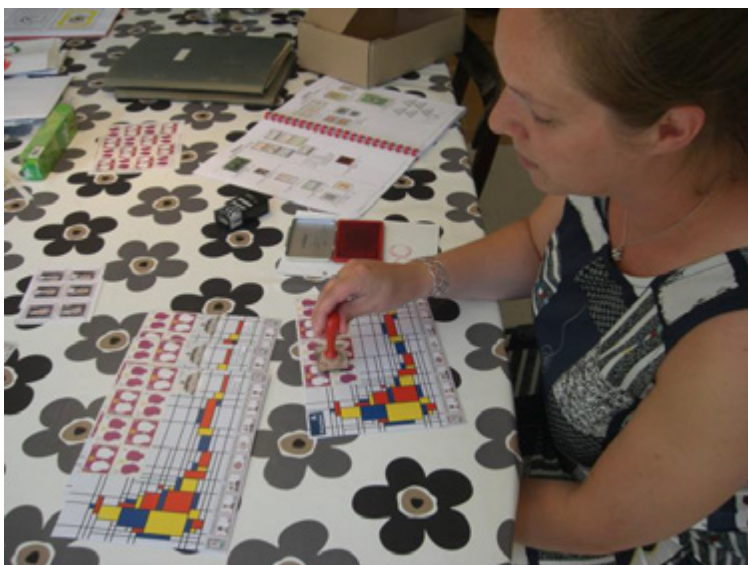
ill. 19 La directrice des postes oblitérant le courrier d'Elleore

légitime. Le ralentissement de l'intérêt des philatélistes, un phénomène mondial, a entraîné la diminution du nombre de timbres-poste émis par Elleore et c'est ainsi qu'aucun timbre n'a été émis en 2013, 2015, 2016 et 2018. Il semble qu'Elleore n'émettra plus de timbres-poste dans l'immédiat, mais les stocks existants depuis les années 1960 restent en usage et sont en vente.