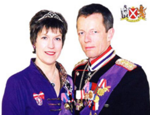
III. 2 Le roi Leo III et la reine Carina

remplacée le même jour par le roi Leo III qui règne toujours (ill. 2). À l'occasion de l'exposition mondiale Stockholmia en juin 2019, le conférencier Bernhard Luerksen a présenté ainsi Elleore (traduit de l'anglais) : quel est le quatrième plus grand royaume de l'Europe du Nord ? Le quatrième plus grand ? Tout le monde n'en connaît que trois ! Mais je suis ici pour vous présenter le quatrième — Elleore !