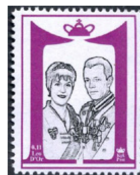
ill. 18 Émis en 2014, 11 e anniversaire du règne du roi Leo III

L'humour n'est jamais bien loin dans les timbres d'Elleore et c'est ainsi qu'une série sur les Ellympiades de 1955 montre le lancer du veau (un veau-jouet!) et la chute à la mer comme disciplines ellympiques ... Mais malgré cet humour, l'administration postale prend très au sérieux l'émission et l'usage des timbres-poste d'Elleore. La directrice des postes, Johanne Wirenfeldt Asmussen (ill. 19) insiste pour que les timbres soient émis en rapport avec l'histoire de l'île et pour que leur usage soit limité à un usage postal