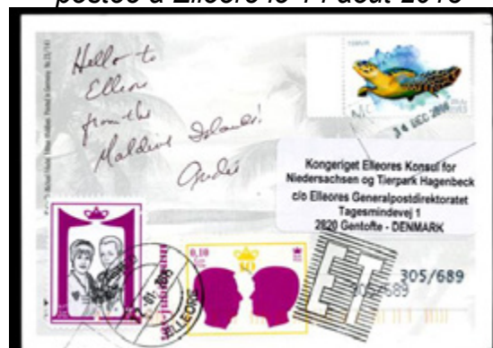
ill. 23 Carte postale expédiée par l'auteur, des îles Maldives à destination d'Elleore