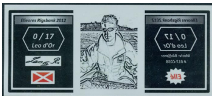
ill. 10 Billet de 0/17 leo d'or émis en 2012

Curieusement Elleore n'est pas très connue des philatélistes même si elle a émis plus de 1 050 timbres en 75 ans sans compter ceux des colonies et les fiscaux. Car en sus des timbres-poste Elleore a aussi émis des timbres fiscaux (ill. 11), des timbres de Noël (ill. 12) et des vignettes officielles. Le Danemark fut le premier pays au monde à permettre l'émission et l'utilisation sur le courrier de timbres de Noël, vendus afin de financer la recherche sur la tuberculose. De nombreuses villes et régions du Danemark émettent leurs propres timbres de Noël et Elleore en a émis annuellement de 1962 à 2017, date de la dernière émission.