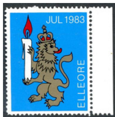
ill. 12 Timbre de Noël émis en 1983