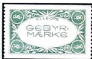
ill. 11 Timbre fiscal de 1962

Curieusement Elleore n'est pas très connue des philatélistes même si elle a émis plus de 1 050 timbres en 75 ans sans compter ceux des colonies et les fiscaux. Car en sus des timbres-poste Elleore a aussi émis des timbres fiscaux (ill. 11), des timbres de Noël (ill. 12) et des vignettes officielles. Le Danemark fut le premier pays au monde à permettre l'émission et l'utilisation sur le courrier de timbres de Noël, vendus afin de financer la recherche sur la tuberculose. De nombreuses villes et régions du Danemark émettent leurs propres timbres de Noël et Elleore en a émis annuellement de 1962 à 2017, date de la dernière émission.