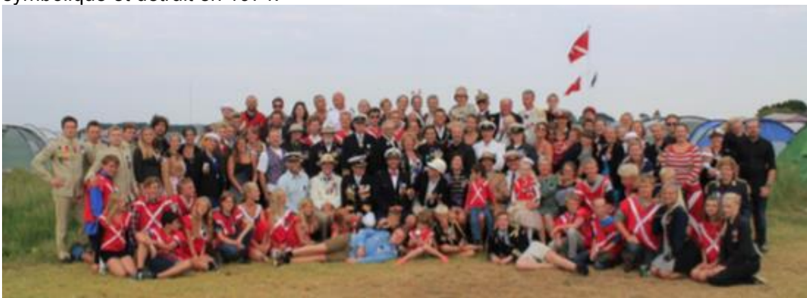
III. 3 La population d'Elleore rassemblée autour de la famille royale à Elleore

L'île a ceci de particulier qu'elle est une réserve pour la protection des oiseaux sauvages durant la saison de reproduction. Et après la fin de la saison de reproduction, toute la cour se transporte à Elleore avec armes et bagages, et bien sûr avec ses sujets, pour une joyeuse semaine de plaisir, de sport et de cérémonies (ill 3). Le tout est fait avec beaucoup de sérieux et en 2019 le Royaume d'Elleore fête ses 75 ans d'existence. Pour servir de quartier général, on construisit un édifice en 1946, mais suite à un jugement obtenu par des activistes verts on dut le démolir en 1960. On fit alors l'achat d'un bateau, le Løvejagden , qui fut éventuellement remorqué et mis à quai pour servir de quartier général. Son nom est inspiré du titre d'un film controversé tourné à Elleore en 1907 durant lequel deux lions furent tués. Ce bateau fut vendu pour une somme symbolique et détruit en 1974.