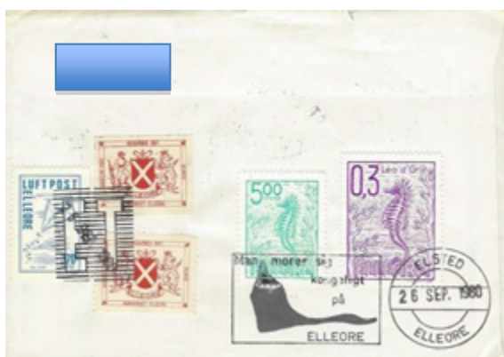
ill. 20 Pli adressé aux États-Unis en 1960, timbres au verso du pli.

sortant. Le courrier à destination d'Elleore qui est préaffranchi de timbres-poste d'Elleore est aussi oblitéré à l'arrivée. Cela permet de créer des plis très intéressants du point de vue philatélique puisqu'ils portent des timbres de deux pays différents. Quelques exemples vous sont proposés ci-dessous (ill. 20 à 26).