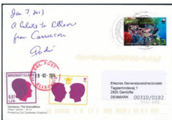
ill. 24 Carte postale expédiée par l'auteur, de l'île Carriacou à destination d'Elleore