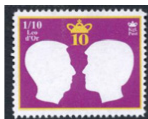
ill. 17 Émis en 2013, 10 e anniversaire du règne du roi Leo III