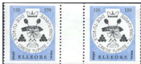
ill. 14 1965, série Académie des cadets de terre

Au fil des années, ils furent conçus et imprimés de façon de plus en plus professionnelle, mais toujours en tirage limité (ill. 14 à 18 ci-dessous).