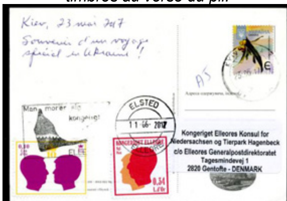
ill. 22 Carte postale expédiée par l'auteur, de Kiev en Ukraine à destination d'Elleore