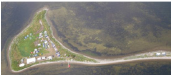
Ill. 1 L'île d'Elleore et sa capitale Maglelille.

Nous sommes en 1944. Le Danemark, comme une grande partie de l'Europe, est occupé par l'Allemagne. La vie n'est pas rose, on s'en doute bien. Des professeurs d'école forment un projet qui égayera les élèves : à une vingtaine de kilomètres à l'ouest de Copenhague une île du fjord de Roskilde pourrait être à vendre et après bien des tractations avec son propriétaire, ils en font l'achat avant de la céder à la Societas Findani , fondation qui en assurera la pérennité. C'est l'île d'Elleore, d'une superficie d'environ 15 000 mètres carrés (ill. 1). Si elle est inhabitée la plupart du temps, on verra plus loin que ce n'est pas toujours le cas. Et les professeurs ont un joyeux projet en tête : proclamer le Royaume d'Elleore, un projet qui prendra rapidement forme, avec un roi élu (le principal de l'école, Erik 1 er ) et sa reine, un gouvernement, sa monnaie valide sur l'île, et bien sûr ses timbres-poste.