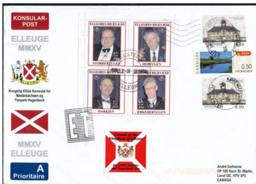
Pli adressé à l'auteur posté à Elleore le 23 août 2015 affranchi de la série de 2013 « Les conseillers du royaume ».