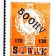
ill. 8 Siwak

La monnaie d'Elleore est utilisée pour tous les achats sur l'île. Il existe des pièces de monnaie depuis 1938 avant même la proclamation du royaume (ill. 9) et des billets de banque (ill. 10) depuis 1945. Les achats peuvent aussi être effectués avec des cartes prépayées. Elleore nomme ses consuls à l'étranger et distribue des titres d'ambassadeur et des titres de noblesse à ceux et celles de ses citoyens dont la conduite est méritoire.