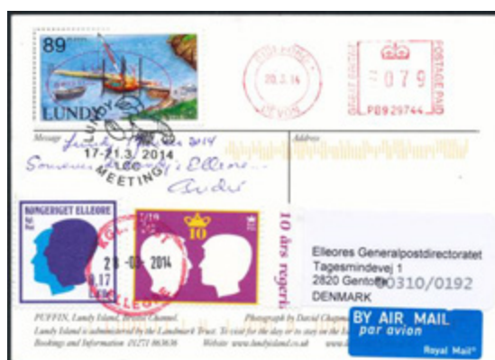
ill. 25 Carte postale expédiée par l'auteur, de l'île de Lundy à destination d'Elleore