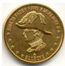
ill. 9 Pièce de 3 leo d'or émise en 1984

La monnaie d'Elleore est utilisée pour tous les achats sur l'île. Il existe des pièces de monnaie depuis 1938 avant même la proclamation du royaume (ill. 9) et des billets de banque (ill. 10) depuis 1945. Les achats peuvent aussi être effectués avec des cartes prépayées. Elleore nomme ses consuls à l'étranger et distribue des titres d'ambassadeur et des titres de noblesse à ceux et celles de ses citoyens dont la conduite est méritoire.