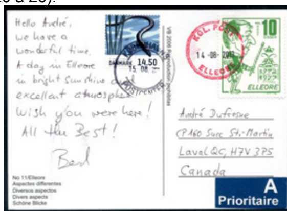
ill. 21 Carte postale adressée à l'auteur, postée à Elleore le 14 août 2013