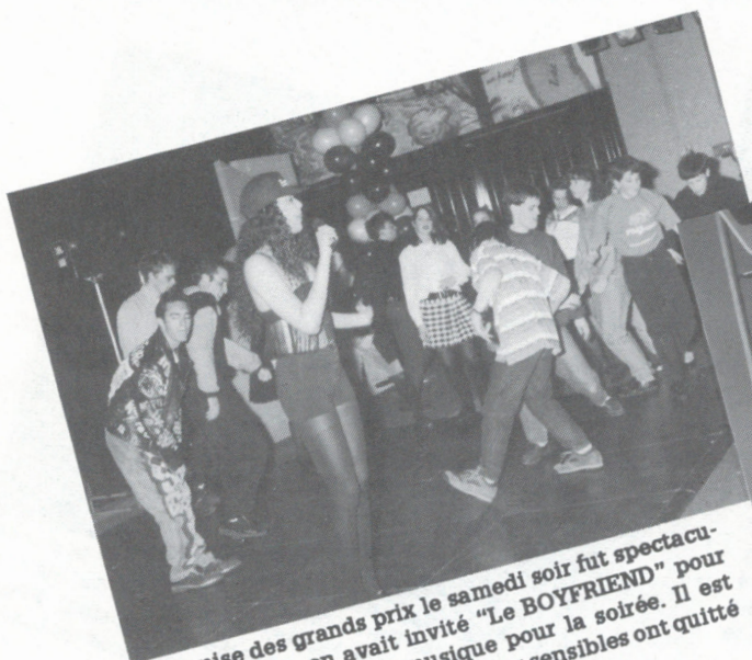
La remise des grands prix le samedi soir fut spectaculaire. En effet, on avait invité "Le BOYFRIEND" pour faire l'animation et la musique pour la soirée. Il est inutile de vous dire que les oreilles sensibles ont quitté de très bonne heure!