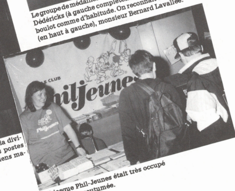
Le kiosque Phil-Jeunes était très occupé comme à l'accoutumée.