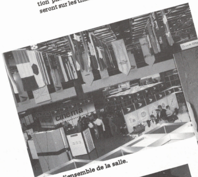
Une vue d'ensemble de la salle.