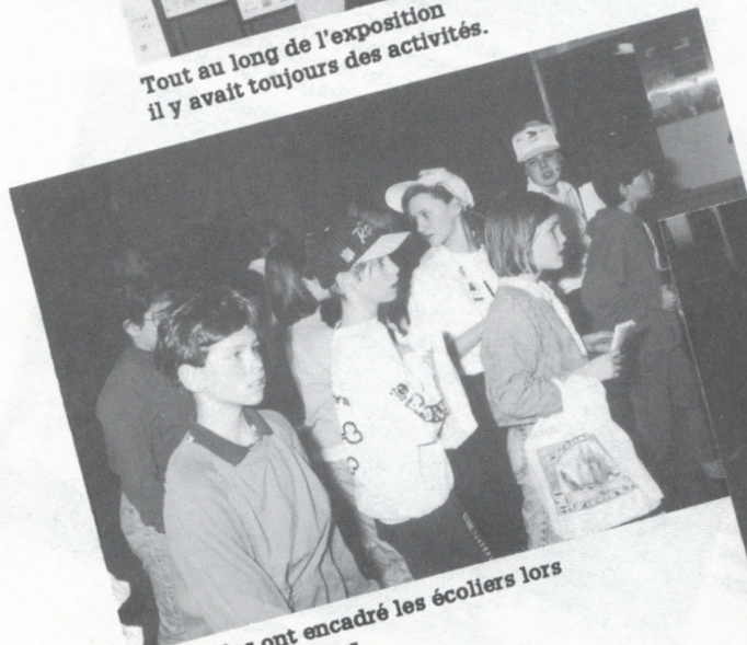
Des guides ont encadré les écoliers lors des visites scolaires.