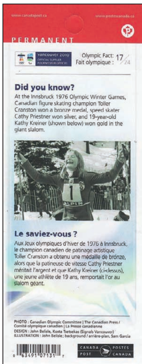
Carnet authentique – verso