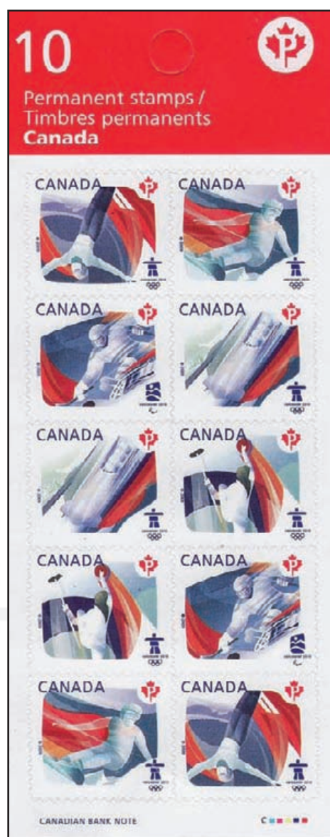
Faux carnet – recto