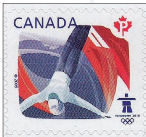
Faux : agrandissement du premier timbre du carnet