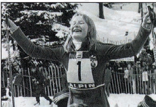
Faux : agrandissement de la photographie au verso