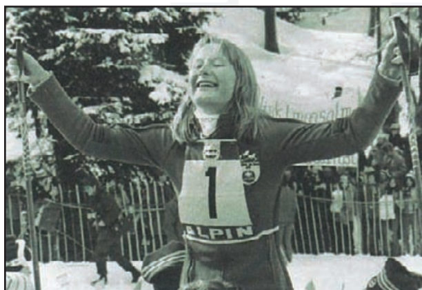
Authentique : agrandissement de la photographie au verso