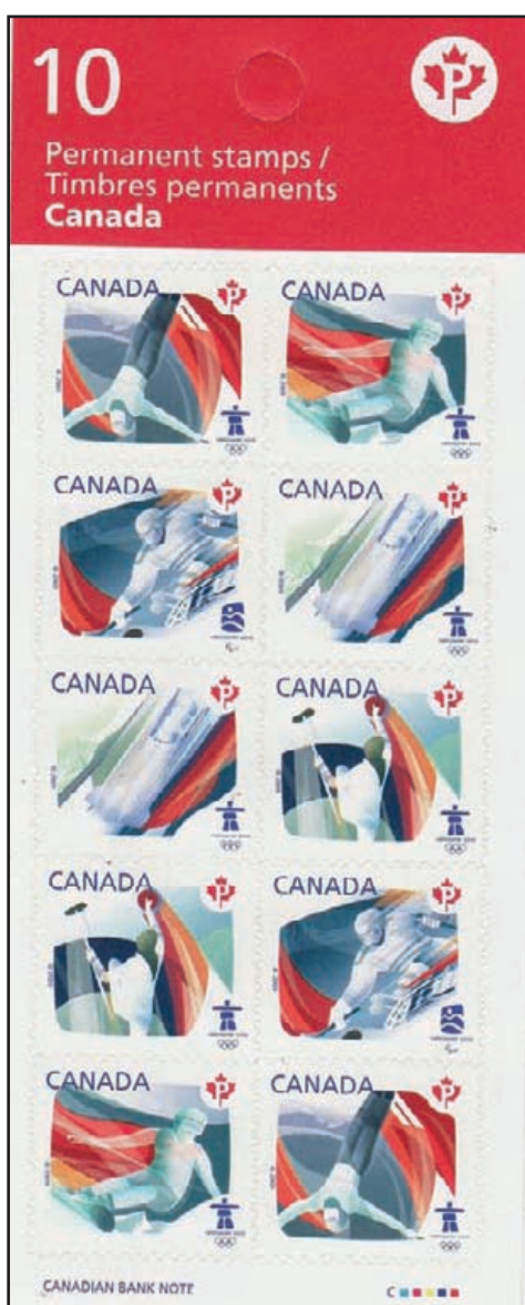
Carnet authentique – recto