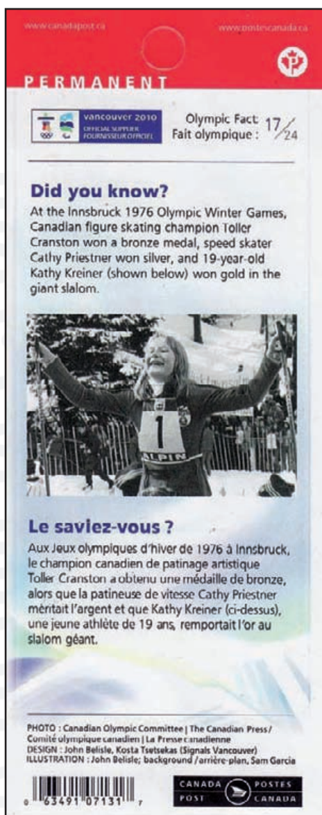
Faux carnet – verso