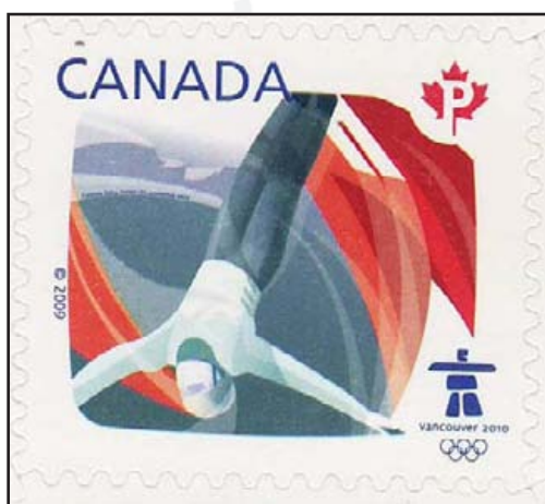
Authentique : agrandissement du premier timbre du carnet