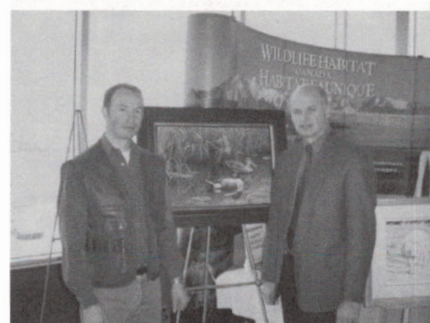
ill. 4 - Habitat faunique Canada