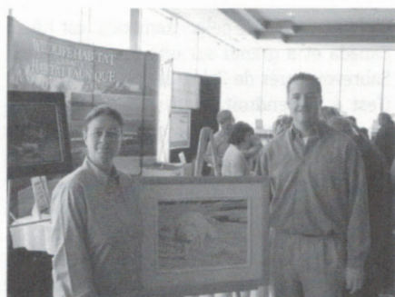
ill. 6 - Fondation Faune Québec

Encourageons ces deux programmes de timbres para-philatéliques qui ont tous deux grandement contribué au fil des ans à la protection et à la conservation des habitats fauniques, tant au Québec qu'au Canada.