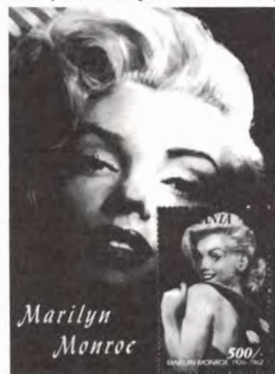
Bloc-feuillet de Tanzanie.

ques de la campagne présidentielle de 1968. (...) En 1962, il était l'impitoyable redresseur de torts d'une famille qui lui en faisait voir de toutes les couleurs. (...) En fait, le premier test familial dans lequel Bobby échoua fut la mission Marilyn Monroe. On l'avait