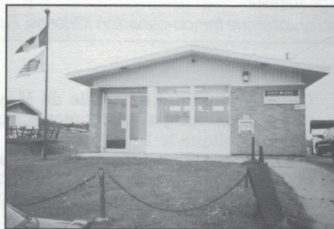
Leslie (427, route 199)