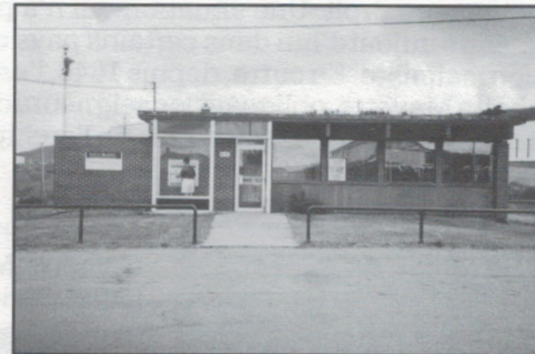
Havre-aux-Maisons (12, chemin le Pré)