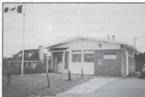
Grande-Entrée (599, chemin Principal, route 199)