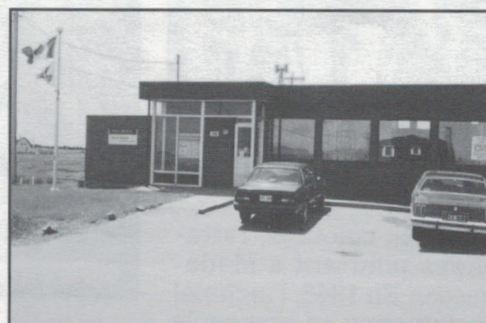
Havre-Aubert (408, Chemin d'en Haut)

Ile d'Entrée. Il s'agit d'une petite cabane jaune, située près de l'église, non loin du phare. Cette petite île est habitée depuis plus de 150 ans par des anglophones d'origine irlandaise et écossaise. La population de l'île d'Entrée compte environ 220 habitants, qui se répartissent en 45 familles portant 16 patronymes différents !