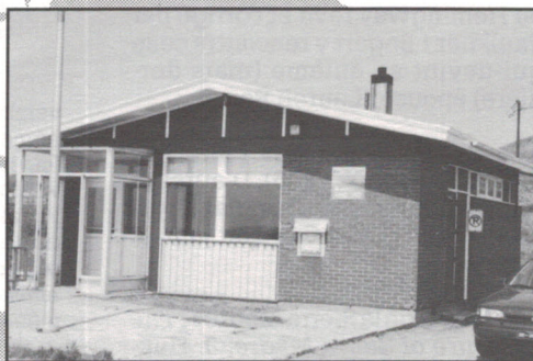
Bassin (Chemin du bassin G0B 1A0)