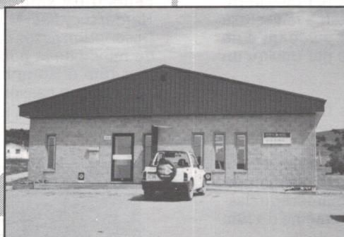
Étang-du-Nord (1498, chemin de l'Étang-du-Nord)