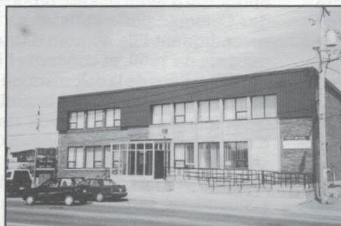
Cap-aux-Meules (235, route 199). Il s'agit du plus gros bureau de poste de l'île près de l'arrivée des traversiers.