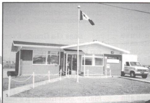
Fatima (608, chemin Principal)

[Téléphone de l'Association touristique des Îles-de-la-Madeleine: (418) 986-2245.]