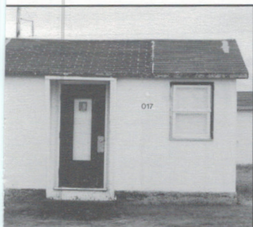
Pointe-aux-Loups (17, chemin du Quai GOB 1P0)