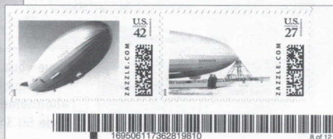
Ill. 3 et 4