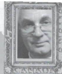
Par : Guy Desrosiers Membre de l'A.E.P.