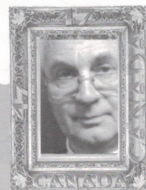
Par Guy Desrosiers