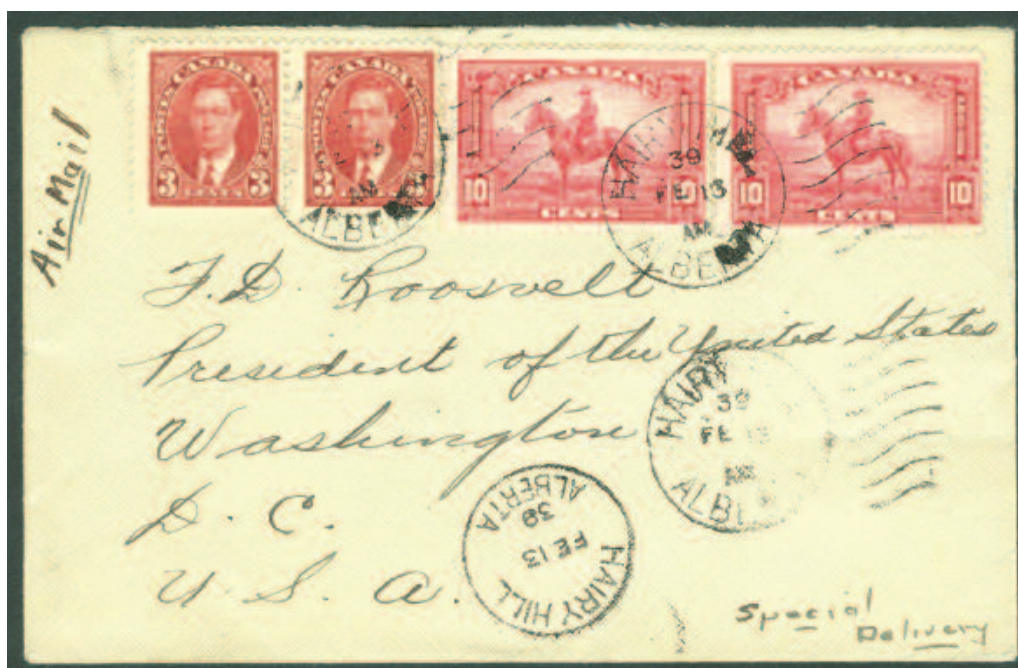
ILL. # 13; Enveloppe oblitérée du 13 février 1939 et adressée au président Roosevelt des USA; elle a déjà fait partie de la collection Roosevelt.