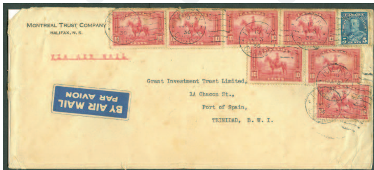
ILL. # 9; Même si légèrement endommagée, plusieurs collectionneurs aimeraient posséder cette enveloppe.