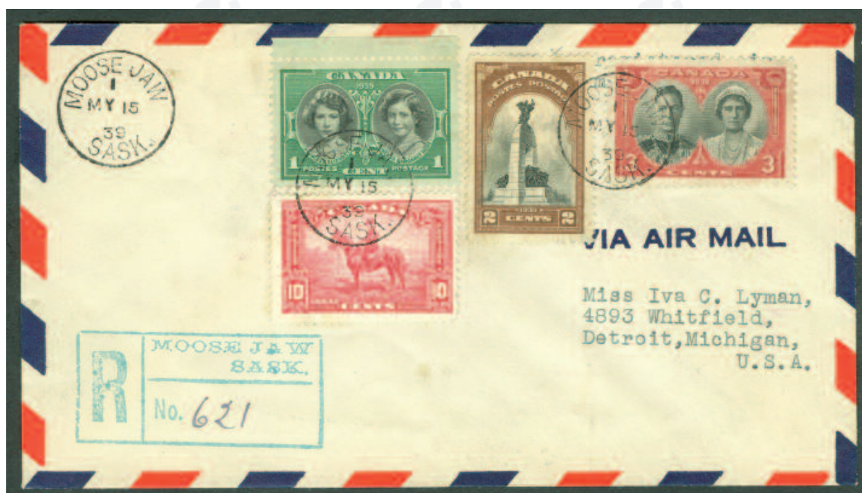
ILL. # 14; Un philatéliste qui, le 15 mai 1939, a réalisé un PPJ portant les trois timbres de la « Visite royale »

Note : l'auteur a publié un fascicule couleur, 108 pages, en 2010, où il y présente quelques unes des 275 pièces de sa collection de plis, cartes postales et cartons « Avis de réception », toutes portant le timbre de la GRC. Chaque pièce est un sujet d'étude en elle-même. De plus, l'auteur mentionne qu'il est toujours à la recherche de pièces portant ce timbre.