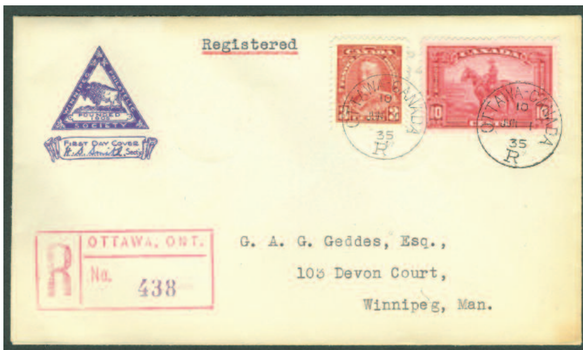
III. # 6; PPJ privé réalisé par le Winnipeg Philatelic Society au Manitoba; ce club est toujours en activité et il a le même logo. Le PPJO n'existait pas au Canada, à cette époque. Le tarif appliqué ici est juste i.e. 10 ¢ pour le courrier recommandé + 3 ¢ pour le tarif régime intérieur.