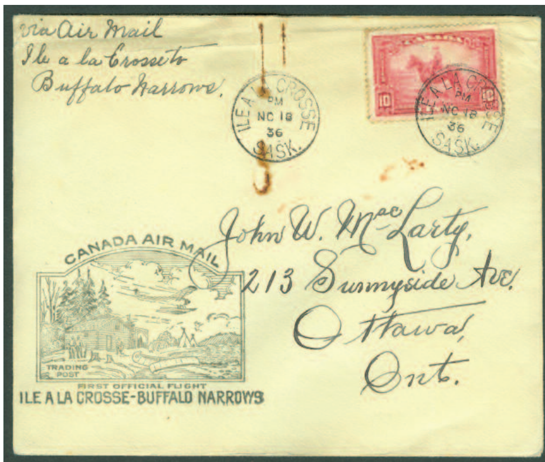
ILL. # 10; Pli Premier Vol avec courrier le 18 novembre 1936, de l'Île à la Crosse vers Buffalo Narrows. Enveloppe affranchie avec un timbre de 10 ¢ alors que le tarif n'était que de 6 ¢.