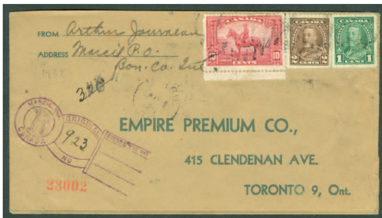
ILL. # 11; Marque d'enregistrement dite « trou de serrure », de Marcil, Qué. Canada, utilisée le 05 avril 1937; il faut noter que nom du bureau de poste de MARCIL avait été changé en celui MARTIN depuis le 10 septembre 1925.