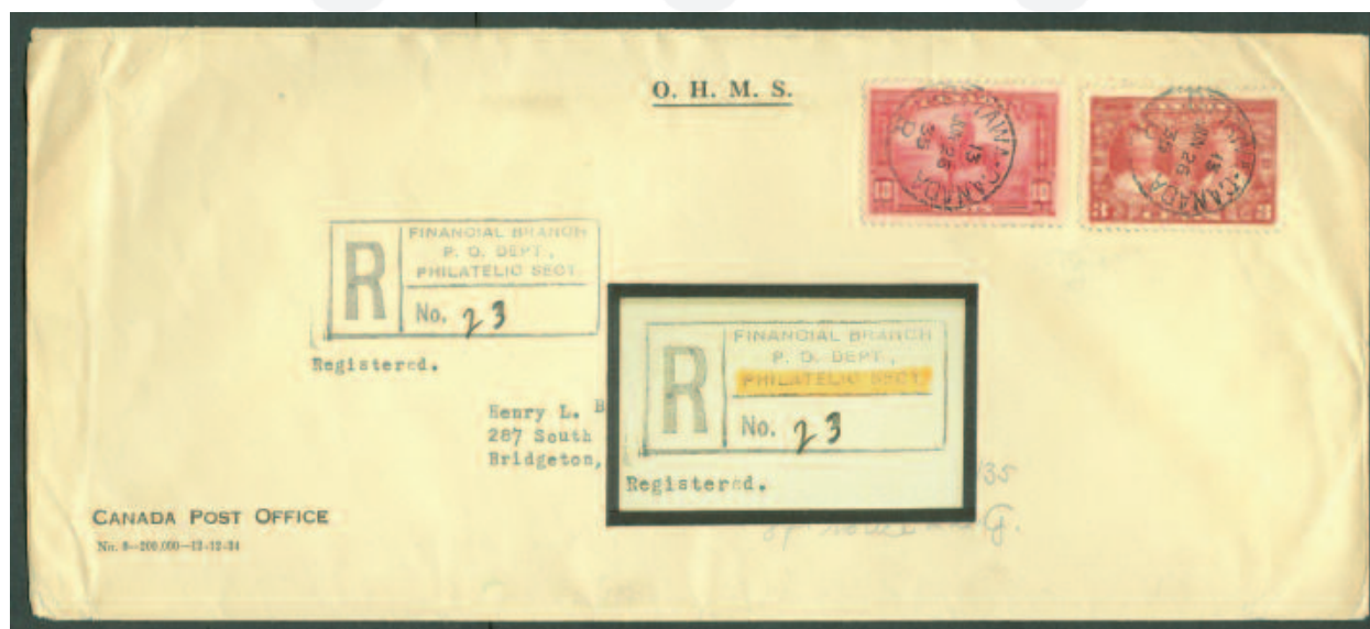
III. # 7; Le Post Office Department du Canada avait une Philatelic Section en 1935.