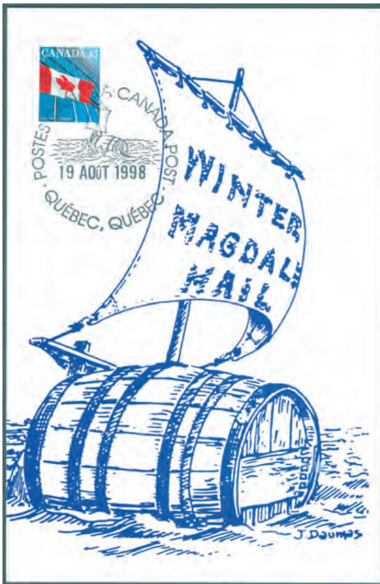
Ill. 1; Cette magnifique carte postale avec marque postale d'occasion, illustre très bien le PONCHON. La marque porte la date du 19 août 1998; à ce jour, nous n'avons trouvé aucune explication sur les motifs qui ont amené la réalisation en 1998, de cette carte et de sa marque postale.

Le courrier, au nombre d'une centaine de lettres parmi lesquelles une qui était adressée au Ministre de la Marine à Ottawa, fut déposé dans des boîtes pour la conserve du homard. Les boîtes furent soudées et le tout introduit dans le tonneau qui fermé solidement, se trouva prêt à prendre la mer. Le lancement eut lieu le 02 février 1910 vers 14h.00 à Havre-Aubert. Le vent ce jour-là, était bon et les vieux assuraient qu'il continuerait à souffler du « nordet » pendant plusieurs jours.