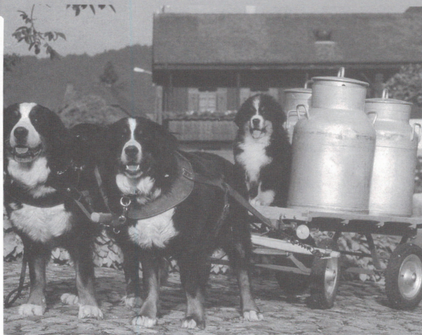
Illustration tirée de La Loupe