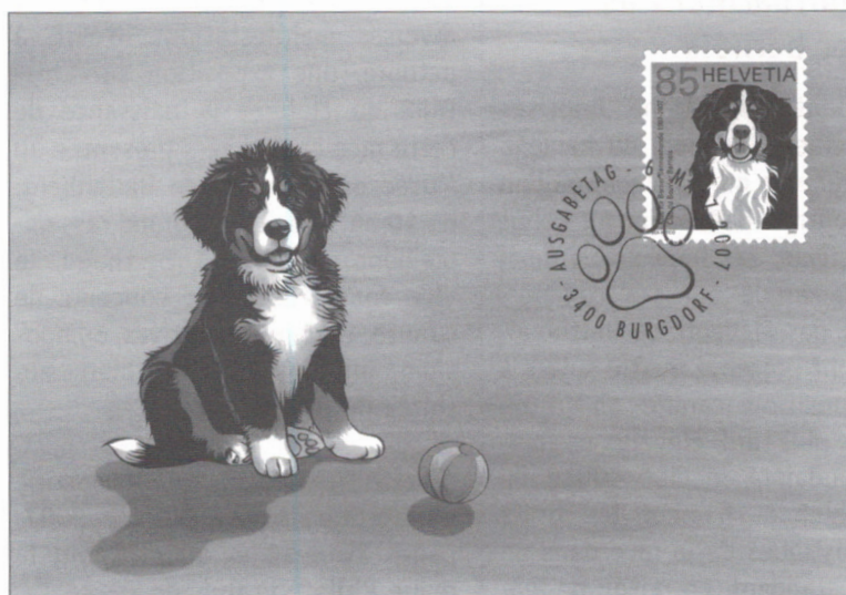
Carte maximum.