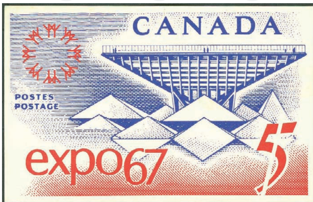
Ill. 2; Carte maximum; reproduction du timbre souvenir montrant le pavillon canadien. Cette carte a été réalisée par The Queen's Printer / L'Imprimeur de la Reine, Ottawa.

Le 28 avril 1967, les Postes canadiennes, pour souligner la tenue à Montréal de l'Exposition universelle et internationale (EXPO 67), émettent un timbre de valeur nominale de 5 ¢ (Ill. 1 et 2). Il s'agissait de la première exposition du genre à se tenir en Amérique du Nord et la troisième dans le monde. Le timbre a pour sujet principal le pavillon du gouvernement canadien, dont la construction a coûté 21 millions de dollars. Comme il convenait à un pays qui tenait le rôle d'hôte et qui célébrait son Centenaire (nous sommes en 1967)