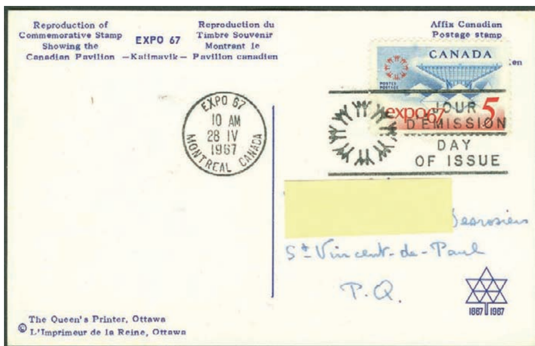
Ill. 3; Verso de la carte maximum illustrée en 2.