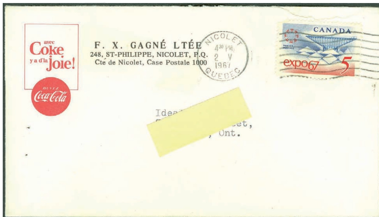
Ill. 4; Enveloppe # 8 qui à voyagé et qui porte le timbre de l'Expo; « avec Coke y a d'la joie! »