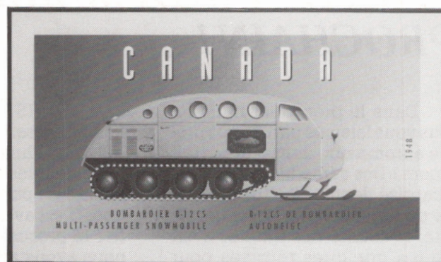
ill. 2: maquette du timbre de 50¢ montrant un véhicule réalisé par Bombardier

trant des motoneiges sorties de ses usines [ill. 2], le dernier étant un timbre de juillet 1997 consacré au design industriel.