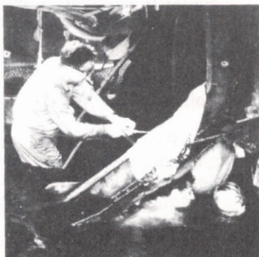
Scène tirée du film The Last Voyage ( Panique à bord ).

Il est un autre navire apparaissant sur un timbre-poste canadien qui a fini par être une grande vedette de cinéma, mais ce fut son ultime rôle. Pour les besoins de son film «Panique à bord» (1959), le réalisateur Andrew Stone acheta le vieux paquebot «Ile-de-France» déjà voué à la ferraille, en instance de départ pour un cime-