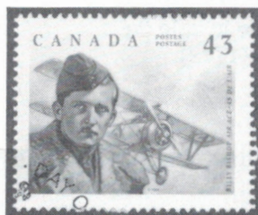
L'aviateur William Avery Bishop.

Quant aux acteurs en chair et en os, nous en avons aussi sur nos timbres. L'as de l'aviation William Avery Bishop, représenté sur un timbre de