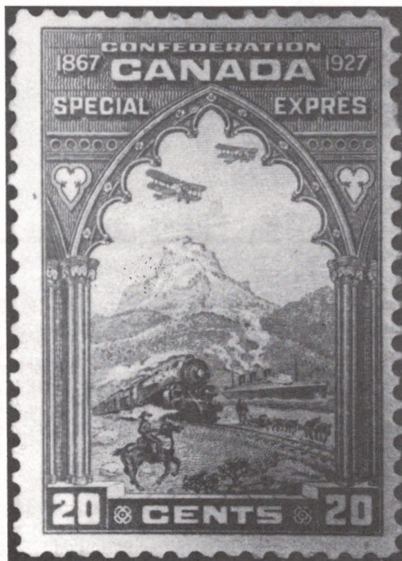
Timbre émis en 1927.

Or, ce même «Ile-de-France» est ce paquebot perdu au milieu de la plaine, au pied des Rocheuses (situation insolite pour un navire) qu'un timbre-poste canadien de