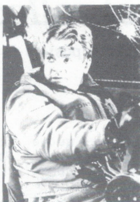
James Cagney, dans une scène du film Captains of the Cloud ( Les chevaliers du ciel ).

quarante-trois cents émis le 12 août 1994, a joué son propre rôle dans le film de la Warner «Les chevaliers du ciel» (Michael Curtiz, 1942). Le film avait été commandé aux producteurs d'Hollywood par la Royal Canadian Air Force et avait un aspect semi-documentaire décrivant l'entraînement des pilotes pour l'aviation alliée. On y voyait en vedette James