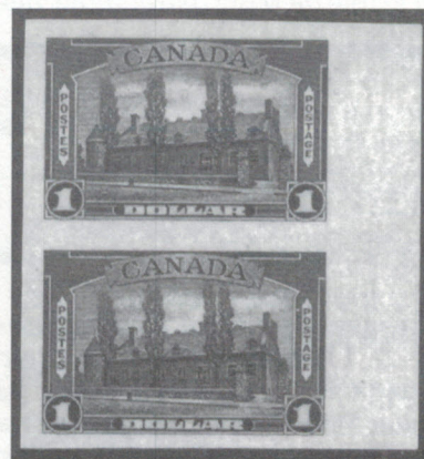
Paire non dentelée du timbre illustrant le Château de Ramezay, émis en 1938.

Nombre des bâtiments historiques représentés sur nos timbres sont situés dans l'arrondissement historique du Vieux-Montréal. Ainsi, l'un des édifices voisins du Château de Ramezay, le marché Bonsecours, situé rue Saint-Paul, a-t-il fait l'objet d'un timbre de 5$ en 1990, dans une série d'usage courant, de valeur élevée, consacrée à l'architecture. Le timbre, toutefois, présente la face arrière