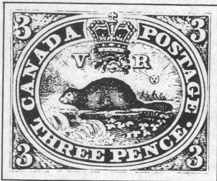
Le célèbre "Beaver Red", le premier timbre canadien, créé en 1851 par l'ingénieur Sandford Fleming.

23 avril tandis que les timbres de 6 et de 12 pence suivirent plus tard, respectivement en mai et en juin. Autre contribution américaine: le papier ayant servi à l'impression de cette première émission fut produit à la main par la firme Ivy Mill, de Chester, en Pennsylvanie. Les premiers stocks livrés montrèrent une grande variété d'épaisseur; la première livraison donna un produit de l'apparence du papier couché puis, par après, l'administration reçut des timbres sur papier vélin, puis du papier vergé dans une gamme de papiers poreux et durs. Ces différentes sortes de papier sont recherchées par les collectionneurs avides de variétés mais une collection sim-