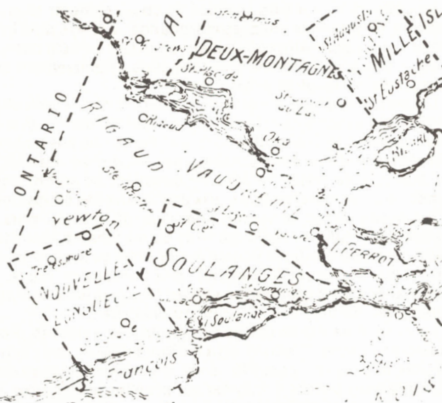
Extrait d'une carte publiée en 1923 par le Bureau du Cadastre de la Province de Québec.

Au cours de son histoire, le comté de Vaudreuil a compté 35 bureaux de poste; il en reste 12 aujourd'hui. Les autres ont été graduellement éliminés par le service de livraison rurale. Notons en passant que des 11 bureaux ouverts avant la Confédération, 7 sont encore en opération. La liste qui suit présente les bureaux dans l'ordre alphabétique des divers noms qui ont été portés, et vis-à-vis chacun l'on trouvera la date d'ouverture, la date de fermeture s'il y a