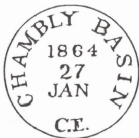
ill. 15 : Changeling de Chambly Basin en date du 27 janvier 1864 sans lettre, tirée de F. W. Campbell, Canadian Postmarks to 1875 , p. 30.

Aux deux plis précédents, il faut également ajouter l'illustration dessinée par Campbell (voir ill. 15) à partir d'une missive qu'il avait probablement manipulée lors de ses recherches en histoire postale et qui était datée du 27 janvier 1864. Voilà pourquoi nous croyons que la marque Changeling attribuée au bureau de Chambly Basin a été utilisée entre 1862 (avril) et 1864 (janvier), pour une durée d'environ deux années complètes.