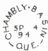
ill. 4 : Petit cercle brisé avec QUE. de Chambly Basin en date du 4 septembre 1864, tirée de F. W. Campbell, Canadian Postmarks to 1875 , p. 30.