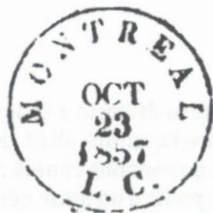
ill. 10 : Changeling de Montréal en date du 23 octobre 1857 sans lettre.

Ce fut la troisième forme de présentation du dateur qui fut la plus utilisée dans les empreintes québécoises de la marque. Outre Chambly Canton, il y a eu les bureaux de poste québécois de Montréal (ill. 10), Québec en partie, Saint-Jean (ill. 11) et Saint-Hyacinthe (ill. 12).