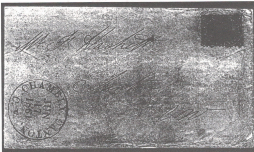
ill. 8 : Pli revêtu d'un Changeling de Chambly Canton en date du 17 juin 1861 sans lettre, Archives nationales du Québec.