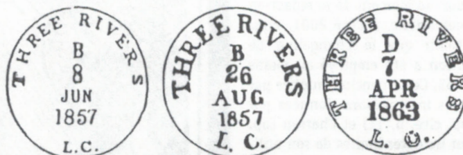
ill. 6 : Les trois types de Changeling utilisés par le bureau de Trois-Rivières.

À cause de l'usure rapide des marteaux, nous avons remarqué que, pour certains bureaux ayant utilisé ce type de marques postales, il y a plusieurs types très différents : lettres fines (1 er type), lettres grasses (2 e type) et lettres creuses (3 e type). L'illustration 6 présente ces différents types du Changeling trifluvien. Qu'en sera-t-il pour les deux bureaux de Chambly? C'est ce que nous découvrirons dans la partie suivante.