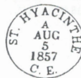
ill. 12 : Changeling de Saint-Hyacinthe en date du 5 août 1857 avec la lettre « A », tirée de F.W. Campbell, coll. J. Nolet et dessin de F. Brisse.