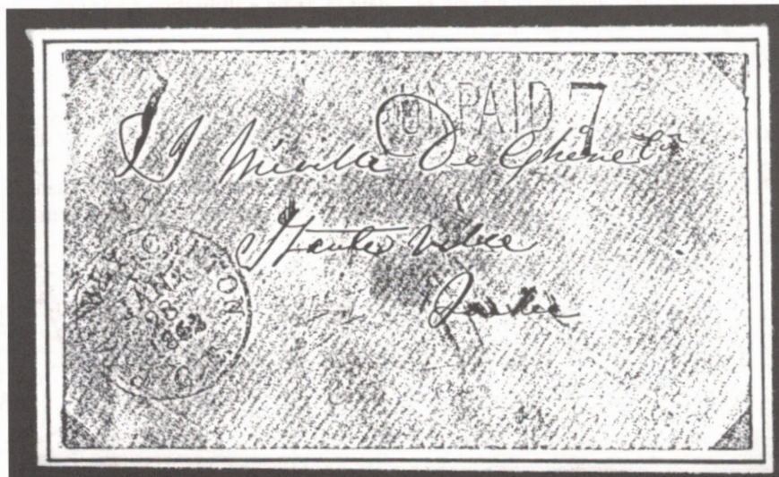
ill. 9 : Pli revêtu d'un Changeling de Chambly Canton en date du 28 janvier 1862 sans lettre, coll. A. Walker.