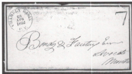
ill. 13 : Pli revêtu d'un Changeling de Chambly Basin en date du 28 avril 1862 sans lettre, coll. A. Walker.

Un premier pli, qui appartenait à la collection formée par David P. Ewens, présentait le Changeling de Chambly Basin en date du 28 avril 1862 (ill. 13). Ce qui devance d'une année la connaissance traditionnelle de son utilisation postale. Un second pli, fourni par François Bienvenue, spécialiste de l'histoire postale de Chambly, a été estampillé par cette marque du Changeling employée par le bureau de poste de Chambly Basin en date du 17 février 1873 (ill. 14).