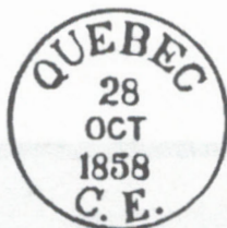
ill. 5 : Changeling de Québec en date du 28 octobre 1858 sans lettre, tirée de Fred Jarret, Stamps of British North America , p. 427.

Il nous faut revenir au dateur composé de trois lignes indiquant la datation de l'apposition de la marque : année, mois et quantième sans ordre apparent. L'étude de l'utilisation du Changeling dans la province de Québec ( Philatélie Québec , n° 230, octobre 2000, p. 29 à 34) a prouvé, hors de tout doute raisonnable, qu'il n'y a pas eu d'ordre strict dans l'emplacement de ces éléments dans la datation, mais plutôt plusieurs présentations différentes. Nous sommes maintenant certains qu'il y a trois formes précises dans l'agencement des trois éléments constituant le dateur inséré dans ce type de marque.