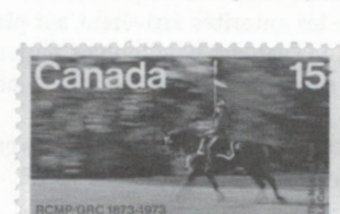
Les trois premiers timbres réalisés par Jean Morin célébraient le centenaire de la Gendarmerie royale du Canada. Ils furent émis le 9 mars 1973.