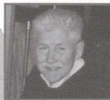
Par : Yvan Leduc, président Société philatélique de la Rive-Sud

N.D.R.L. : La revue tient à féliciter de cette initiative, la Société philatélique de la Rive-Sud. Les lecteurs sont à même de constater les grands résultats d'une petite annonce dans la revue.