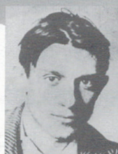
Pablo Picasso Bateau-lavoir Paris 18 e

Notre randonnée pédestre s'est terminée après avoir observé l'extérieur de ce temple de la musique, de la danse et du french-cancan.