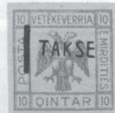
ill. 4 – Timbre orange avec aigle à double tête.