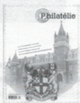
n° 241 Mars-Avril 2003