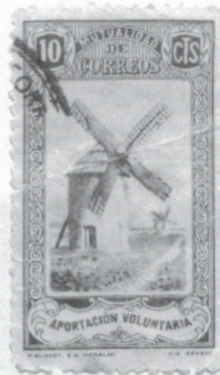
ill. 3 – Timbre noir avec moulin à vent.