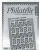
n° 240 Février 2003

Vous avez manqué un de ces numéros? Vous désirez vous le procurer?