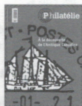
n° 247 Mars-Avril 2004