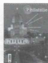
n° 248 Mai-Juin 2004