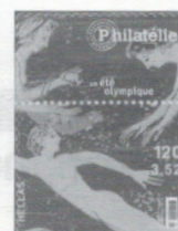
n° 249 Juillet-Août 2004