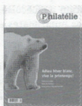
n° 242 Mai-Juin 2003