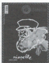
n° 245 Novembre-Décembre 2003