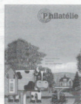
n° 243 Juillet-Août 2003

Rien de plus simple, vous n'avez qu'à communiquer avec nous!