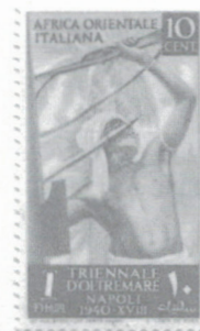
ill. 1 – Timbre de l'Afrique orientale italienne.

275, rue Bryant Sherbrooke QC J1J 3E6 editions.ddr@videotron.ca