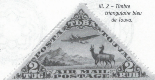
ill. 2 – Timbre triangulaire bleu de Touva.