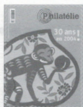
n° 246 Janvier-Février 2004