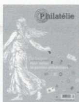
n° 244 Septembre-Octobre 2003

275, rue Bryant Sherbrooke QC J1J 3E6 editions.ddd@videotron.ca