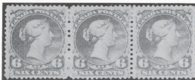
Bande de trois à l'état neuf du 6¢ «grande reine» (Scott, n° 27).

Un timbre en particulier, une étude de carnets, des empreintes de machine à affranchir, une série de timbres, tous ces exemples constituent des collections spécialisées, des collections où l'on s'affirme spécialiste . Il va de soi que les connaissances philatéliques manifestées doivent être alors très pointues . Il faut s'en tenir strictement au sujet concerné. Si je choisis de faire voir tout ce qui a trait à un timbre en particulier, c'est de ce timbre que je dois parler et non de l'oblitération qui apparaît sur celui-ci, non plus que de son support ou de toute autre chose qui n'est pas reliée étroitement avec le timbre.