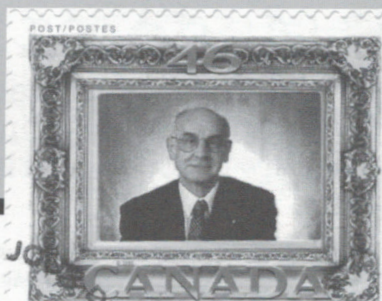
Par : François Brisse, AEP, AQEP

À noter que, comme le cadre et la photo sont tous les deux des auto-collants, il est difficile de les décoller des enveloppes sans séparer la photo du cadre. Je recommande donc de ne pas les décoller et de garder les timbres-photos sur l'enveloppe et ...de vous faire de belles enveloppes-souvenirs.