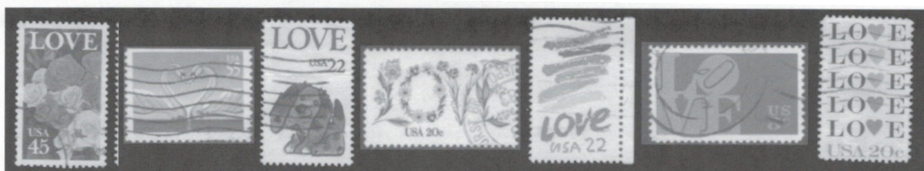
Timbres des États-Unis célébrant l'amour (Love).