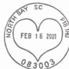
Oblitération de North Bay, ON.

Depuis quelques années le bureau de poste de North Bay utilise un oblitérateur illustré d'un très gros coeur.