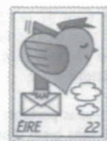
Timbres-poste d'Autriche, d'Irlande et de Hong Kong.