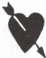
Oblitération de fantaisie de Waterbury, CT, utilisée seulement en 1869.

À la suite du succès des bureaux de poste de Love et de Saint-Valentin, d'autres communautés ont demandé des cachets dont l'illustration est en rapport avec l'amour. Ainsi, Hearts Content et Cupids, NL, ont reçu une nouvelle oblitération qui fut mise en service en avril 2003.