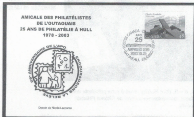
ill. 3 - Enveloppe officielle représentant l'œuvre de Nicole Lacourse.