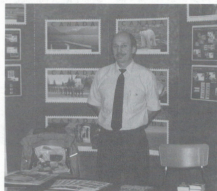
ill. 12 – Kiosque de Postes Canada.

Si le succès d'une telle exposition se mesurait au nombre de personnes qui sont venues la visiter, on peut dire qu'Amphilex a été une grande réussite, dépassant toutes nos espérances. Même le temps a été de notre côté avec une fin de semaine pluvieuse qui incitait aux activités intérieures. Ce succès est le fruit du travail d'un petit groupe de volontaires et d'amis qui ont œuvré sans retenue pendant plusieurs mois pour mener à bien cette entreprise. Amphilex a été honorée de la visite de télévisions locales (Radio-Canada et TVA) et a fait l'objet de reportages, tant à la télévision qu'à la radio.