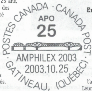
ill. 1 - Cachet officiel de Postes Canada, en service les 25 et 26 octobre 2003 à Gatineau, à l'occasion de 25 e anniversaire de l'APO.

Ces enveloppes sont encore disponibles en nombre limité. Il est possible de se les procurer en écrivant ou en téléphonant à l'auteur (☎ 613-722-7279 ou ✉ isabelle.alain@sympatico.ca). Leur coût est de 3 $ pour une ou 5 $ pour les deux (plus frais d'envoi).