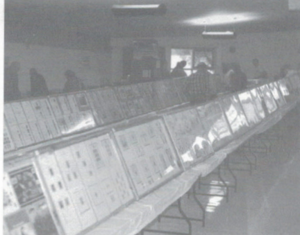
ill. 9 – Au total 90 cadres de 10 pages chacun, regroupés au centre de la salle de l'exposition, ont été présentés au public.