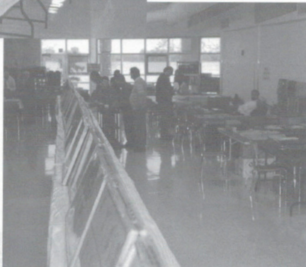
ill. 10 – Cadres d'exposition au centre et tables de marchand autour de la salle d'exposition.

Afin d'inciter le plus grand nombre de nos membres à participer à Amphilex, le conseil de l'APO avait décidé que les collections exposées ne seraient pas jugées officiellement et qu'aucune règle stricte ne serait à suivre. 900 pages de collections ont été exposées, toutes sorties directement des collections de membres de l'APO (ill. 9 à 11). Au total, seize de nos membres ont participé, soit près d'un tiers de notre effectif, une grande réussite! En plus des 24 collections exposées, les visiteurs ont eu le plaisir de pouvoir faire connaissance avec l'art de la gravure. Yves Baril, graveur de nombreux timbres canadiens et membre de notre club, exposait en effet dans un cadre spécial ses principaux outils de graveur.