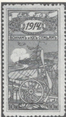
Vignettes russes émises pour le fond patriotique