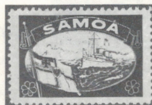
Vignette allemande protestant contre la perte par l'Allemagne de ses colonies au Traité de Versailles (1919).