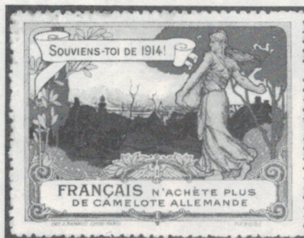
Vignettes françaises de propagande anti-germanique (1919-20).