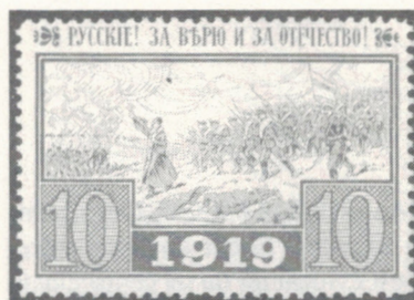
Au lendemain de son retrait du conflit et de la prise du pouvoir par les Rouges, la Russie est plongée dans une guerre civile qui durera jusqu'en 1921. Ci-dessus, vignette de propagande au profit des armées blanches.

TIMBRES LAURENTIDES 234, rue Parent, St-Jérôme QC SERVICE POSTAL C.P. 127, St-Jérôme, QC J7Z 5T7 CANADA - U.S.A. - EUROPE OUEST MANCOLISTES Tél.: (514) 438-4474