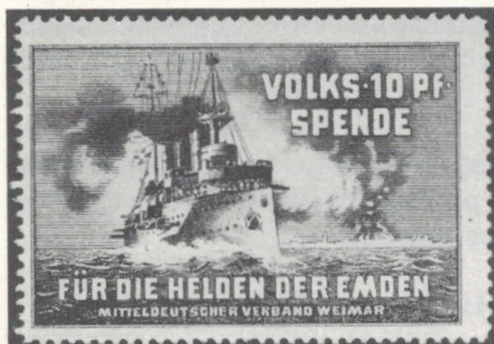
Vignettes des puissances centrales destinées à amasser des fonds pour la constitution d'une flotte de guerre.