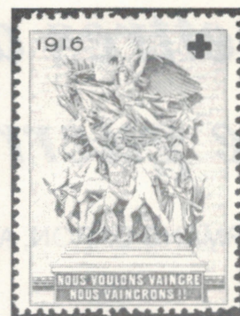
Vignettes autrichienne et française destinées à amasser des fonds pour la Croix-Rouge et le secours aux blessés de guerre.