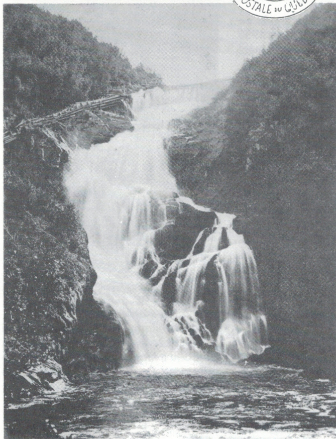
No. 44 Chûtes Quiatchouan