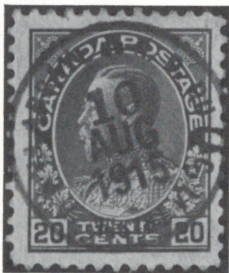
Oblitération circulaire utilisée en 1915 et portant l'inscription LA TRAPPE D'OKA ABBAYE N.D. DU LAC.

Vint ensuite un personnage quasi-légendaire, le Révérend Père Pacôme Gaboury qui, du 27 décembre 1913 au 18 juin 1964, soit durant 51 ans, préside à sa destinée. Le troisième et dernier maître de poste fut le Révérend Dom Fidèle Sauvageau qui officia du 16 juin 1964 au 9 août 1969, date de la fermeture des opérations postales à l'abbaye de La Trappe.