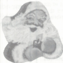
FIG. 4 Un exemple typique de vignette pour carte de voeux

D'aucuns commencent à s'intéresser à certaines vignettes émises par l'entreprise privée pour "sceller" cadeaux et cartes de voeux; si plusieurs dizaines de modèles courants existent (fig. 4), il s'avère beaucoup plus difficile de recueillir un exemplaire ayant l'âge de nos pères. La collection de telles vignettes est populaire en France notamment, mais son intérêt est plus strictement thématique, et se limite aux amateurs de bizarrerie.