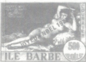
FIG. 3 Timbres de Noël émis par l'île de Lundy (Angleterre) le 19 novembre 1976 et par l'île Barbe (France) le 20 novembre 1977

D'aucuns commencent à s'intéresser à certaines vignettes émises par l'entreprise privée pour "sceller" cadeaux et cartes de voeux; si plusieurs dizaines de modèles courants existent (fig. 4), il s'avère beaucoup plus difficile de recueillir un exemplaire ayant l'âge de nos pères. La collection de telles vignettes est populaire en France notamment, mais son intérêt est plus strictement thématique, et se limite aux amateurs de bizarrerie.