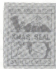
FIG. 6 Timbre de Noël émis le 26 novembre 1932 pour les soldats anglais en Egypte.

Enfin, les plus sérieux d'entre nous (ou peut-être les plus grincheux!) peuvent se tourner vers les "classiques"; par exemple les timbres de Noël destinés à l'Usage des corps expéditionnaires britanniques en Egypte de 1932 à 1939 (fig. 6), ou les timbres de Croix-Rouge émis en Jamaïque, à Grenade et à la Trinité de 1914 à 1918!