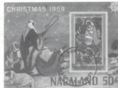
FIG. 5 Timbre en trois dimensions émis pour le Royaume du Yémen à l'occasion de Noël 1970; et bloc-feuillet émis pour le Nagaland (Inde) le 30 décembre 1969

"pour" des soi-disant Etats, des groupes révolutionnaires, ou encore par des Agences Philatéliques agissant sans autorisation ou à l'insu du pays concerné. On regroupe généralement ces vignettes sous le vocable plus ou moins judicieux de "timbres de propagande" (fig. 5). Ceux-ci ont l'avantage d'être nombreux et colorés, et dans certains cas revendiquent une certaine légitimité.