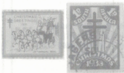
FIG. 2 Timbres de Noël émis Décembre 1978.

On retrouve ces timbres dans plusieurs pays du monde (fig. 2) et partout leur popularité s'accroît. Le catalogue Scott spécialisé pour les Etats-Unis en donne une nomenclature avec prix, ce qui, en soi, devrait justifier une certaine popularité au Québec, connaissant la malheureuse tendance du collectionneur Québécois à ne jurer que par Scott!