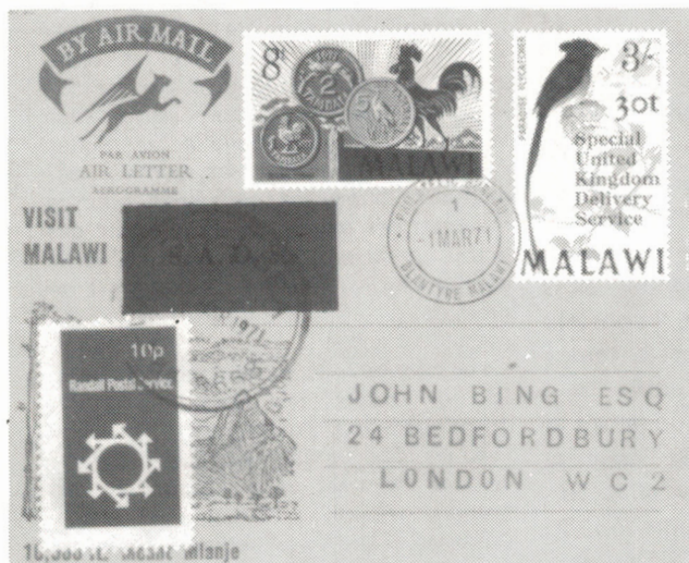
Aérogamme posté au Malawi, avec timbre de grève surchargé "30t" "Spécial United Kingdom Delivery Service", acheminé par l'intermédiaire de deux entreprises privées, Spécial Air Delivery Service et Randall Postal Service.

Les collectionneurs canadiens connaissent bien les timbres émis par les postiers au cours de la grève des postes de 1975-1976. Peu d'entre eux savent que les timbres de grève sont une tradition remontant au début du 20 ème siècle, et même avant. Dans la majorité des pays du monde, l'Etat a le monopole du transport du courrier de première classe: donc s'il y a grève, le pays entier est privé de livraison postale.