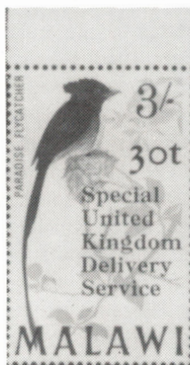
Timbre émis par le Malawi pour l'acheminement du courrier à destination du Royaume-Uni durant la grève des postes de 1971.

Evidement des spéculateurs cherchant la fortune s'en sont mêlés, et on a vu, en Angleterre, une entreprise appelée "Public Mail Service" émettre