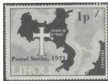
Timbre émis par l'île de Lihou pour l'acheminement du courrier des îles Anglo-Normandes à l'Angleterre, 1971.

plus d'une centaine de vignettes ressemblant à des timbres-poste, en l'espace de deux mois. Une collection complète coûtait en 1971 (et coûte toujours) $70.00!