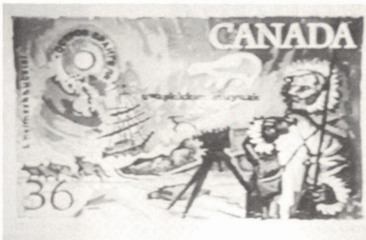
Série Exploration: Joseph Burr Tyrell. N'ayez crainte: Série Exploration: Vilhjalmir Stefansson la valeur faciale sera sûrement corrigée à temps!