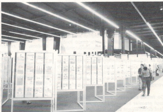
Une vue des cadres d'exposition.