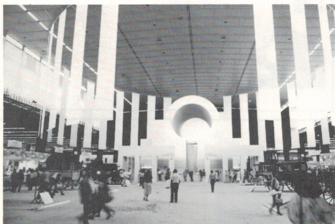
La grande place de Philexfrance donne une idée de l'ampleur de l'événement.