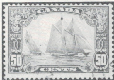
Une falsification de «l'homme dans le mât».