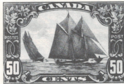
M. Merrywater, abandonné à tout jamais sur le pont avant du Bluenose .