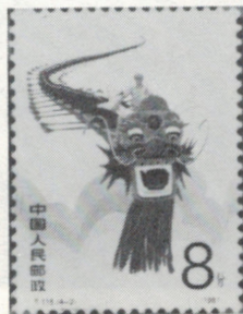
Ralph chevauchant le dragon-cerf-volant

On retrouvera aussi Ralph monté en croupe derrière la célèbre «Police Montée» ou encore chevauchant un gigantesque cerf-volant-dragon sur un timbre de la République Populaire de Chine. On découvrira finalement Ralph et Tommy dans le désert australien sur un timbre de ce même pays. En prime, l'affiche du film laisse entrevoir quatre autres vignettes toutes aussi fictives les unes que les autres.