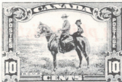
Un compagnon inusité pour notre célèbre «Police Montée».