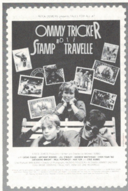
L'affiche du film L'ALBUMinable HOMME DES TIMBRES (Tommy Tricker and the Stamp Traveller).