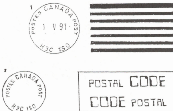
Illustration 1: Impression obtenue avec l'IPS-2 modifiée de Centre-Ville, en usage depuis mai 1991.

Une machine comparable fonctionne maintenant à l'ETL de St-Laurent, rue McArthur. Ici, c'est la machine IPS-2 numéro 2 qui a été modifiée. Le bloc dateur indique le code postal de l'établissement, H4T 1A0, et le slogan qui n'a pas été remplacé est donc celui qui porte la mention CODE POSTAL/POSTAL CODE. Ici aussi c'est le bloc dateur de l'IPS-2 qui porte la date. Une deuxième tête oblitérante, couronne et slogan, a été ajoutée au-dessus de celle de l'IPS-2. Il s'agit de pièces cannibalisées de la machine Toshiba numéro 4. Comme à Centre-Ville, le bloc dateur de la Toshiba est sans date. Les dimensions et positions relatives des deux impressions (de Centre-Ville et de St-Laurent) sont identiques. Ici encore, la zone oblitérante est de 66x105mm. La première date rencontrée est celle du 23 mars 1993 (illustration 2).