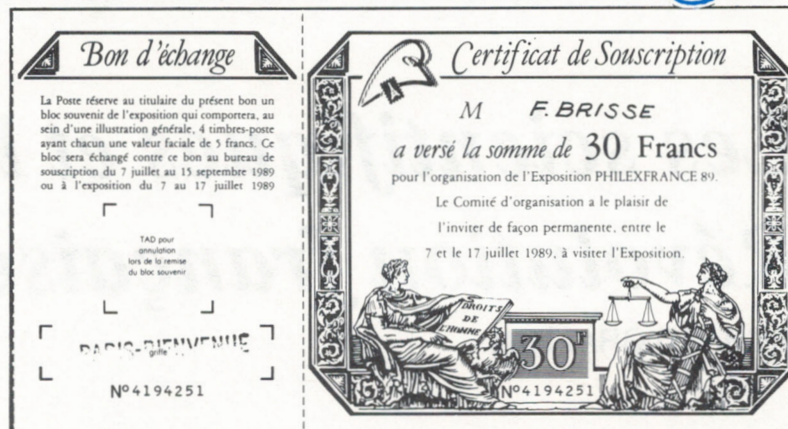
Coupon de souscription à Philexfrance

C'est en souvenir de cette période que le certificat de souscription à Philexfrance 89 a été émis en forme d'assignat. La somme de 30F est une contribution du souscripteur à l'organisation de l'exposition.