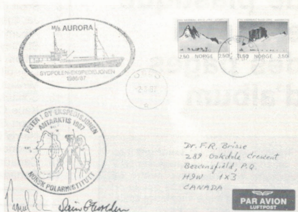
Fig.1. Enveloppe ayant été transportée par l'expédition.