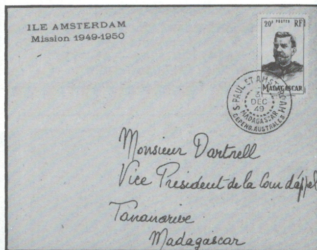
Figure 4 - Lettre postée à St-Paul et Amsterdam au cours de la mission 1949-1950. L'oblitération indique «ST-PAUL ET AMSTERDAM, MADAGASCAR, DEPEND. AUSTRALES» et la date du 31 décembre 1949