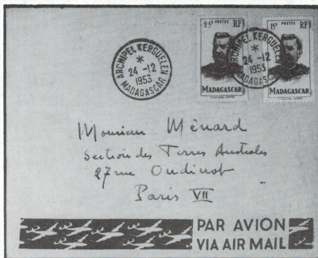
Figure 3 - Lettre affranchie de timbres de Madagascar postée aux îles Kerguelen. L'oblitération porte la mention «ARCHIPEL KERGUELEN, MADAGASCAR» et la date du 24 décembre 1953