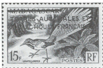
Figure 6 - Le premier timbre des Terres Australes et Antarctiques Françaises fut un timbre de Madagascar surchargé «TERRES AUSTRALES ET ANTARCTIQUES FRANÇAISES».