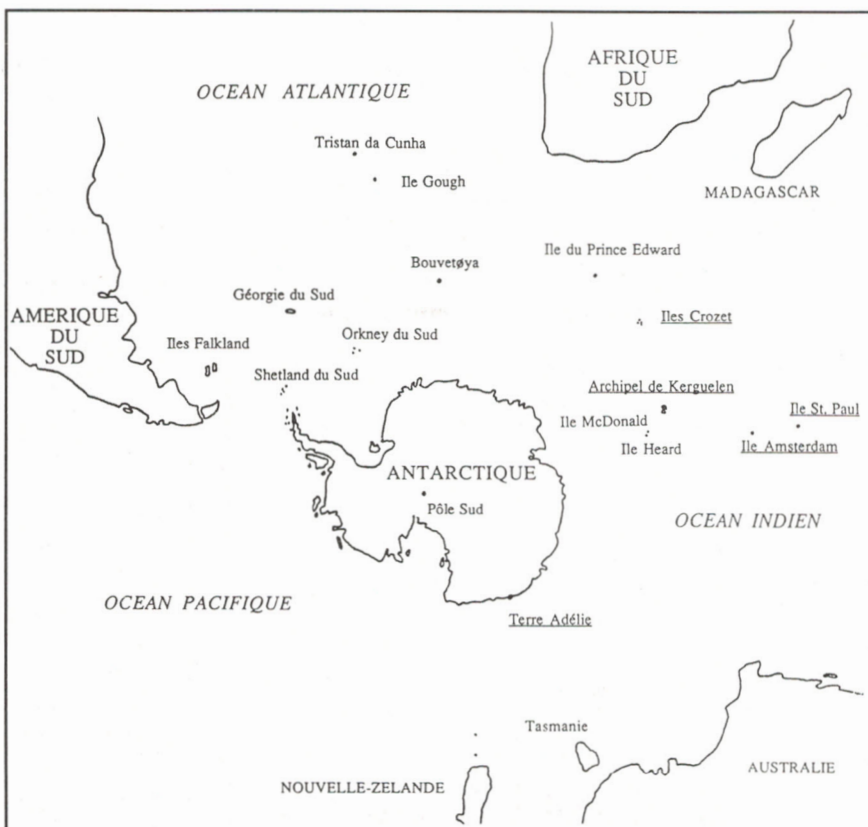
Carte de l'Antarctique et des continents voisins. Les îles et territoires soulignés faisaient partie des dépendances australes de Madagascar.