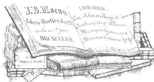
Carte de visite. Circa 1859/1862.